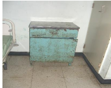
Mesa de noche habitaciones pacientes