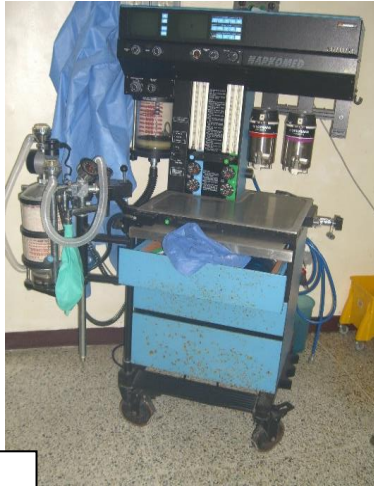
Cama de Parto