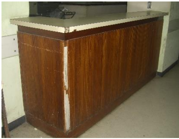
Mostrador principal, vista exterior ala izquierda, estar Enfermería