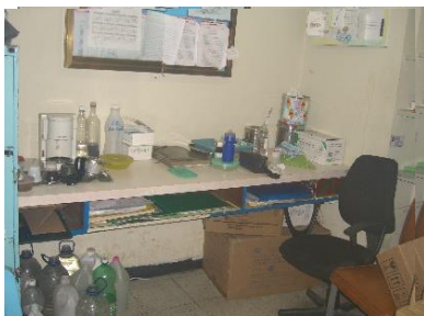
Escritorio empotrado a la pared, oficina jefatura, estar Enfermería