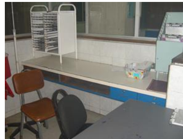
Escritorio empotrado a la pared, estar Enfermería