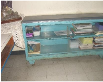
Vitrina del estar de Enfermería