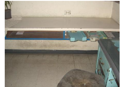
Escritorio empotrado en la pared, estar de Enfermería