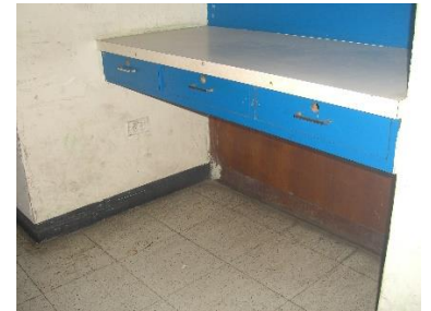
Vista interna mostrador principal de enfermería