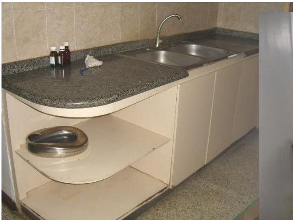
Gabinete Faena limpia