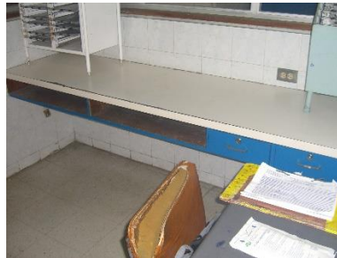
Escritorio empotrado en la pared, estar de Enfermería