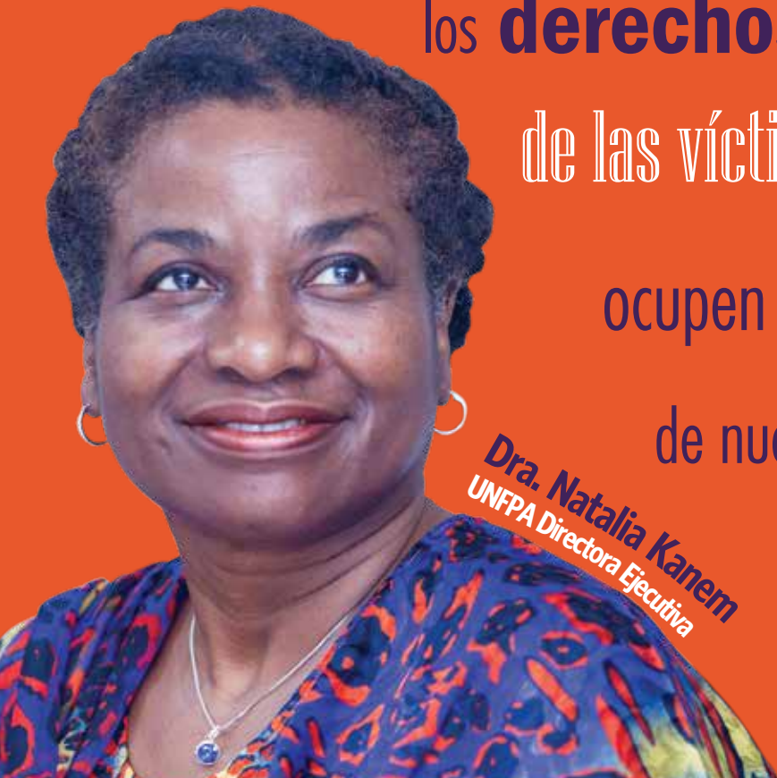
Dra. Natalia Kanem UNFPA Directora Ejecutiva

DETENER LA EXPLOTACION Y LOS ABUSOS SEXUALES