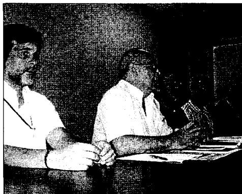
El alcalde realizando la presentación del encuentro

Un cambio de "gran calado y evidentemente en Naciones Unidas estamos muy interesados primero conocerla bien y luego ponernos a la orden, para ver en qué medida podemos contribuir a ese proceso"